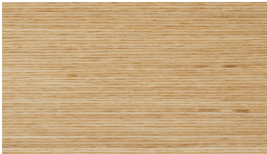
A1 Oak | Chêne | Eiche