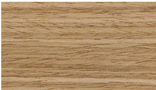
AA Oak | Chêne | Eiche