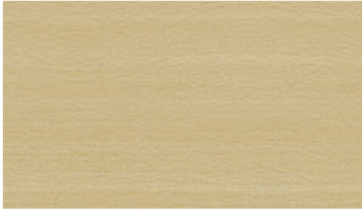
V1 Ash | Frêne | Esche