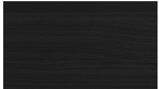
N61 Ash stained black | Frêne teinté noir | Schwarz gebeiztes Eschenholz