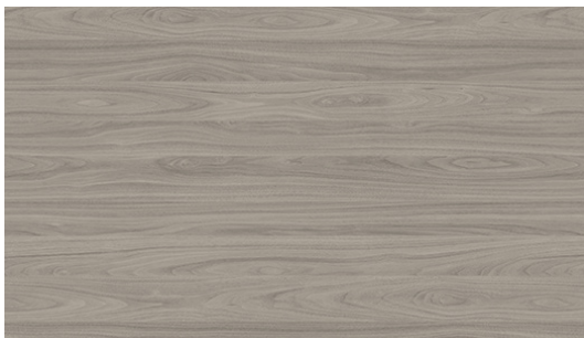
N63 Walnut stained grey | Noyer teinté gris | Grau gebeiztes Walnussholz