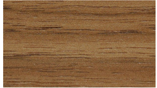
RR Walnut | Noyer | Walnuss