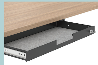
Filzbeschichtete Metall- schublade mit Schloss