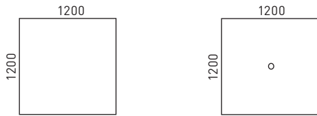
Höhenverstellbare Konferenztische mit Betonsockel